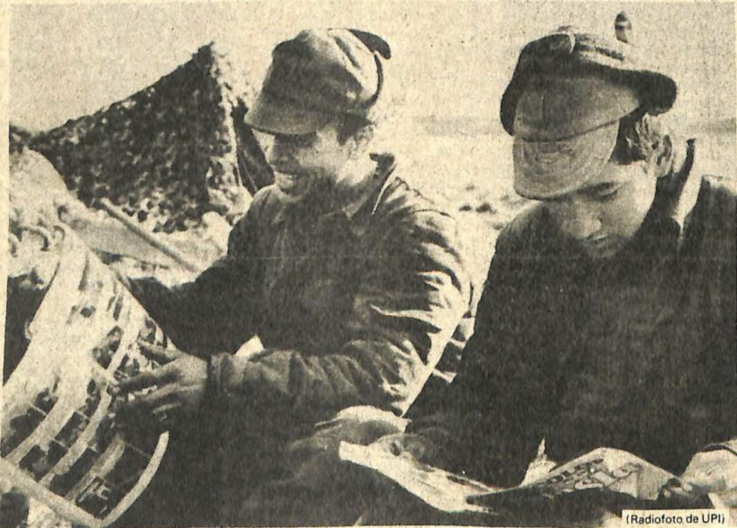
Soldados argentinos leen revistas de historietas, durante un momento de esparcimiento en las islas Malvinas.

Mañana, en la Cámara de los Comunes, la señora Thatcher deberá hacer frente a los embates de la oposición claramente alineada ahora, con la búsqueda de canales diplomáticos para una resolución pacífica del diferendo sud-atlántico, señalaron fuentes parlamentarias.