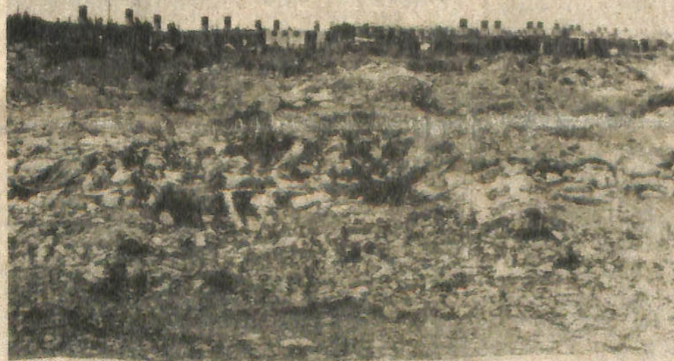
Esta es una deprimente imagen en las proximidades del barrio Parque Industrial. El lugar se ha convertido en un basurero público, sin control alguno. No hay alumbrado público que pueda atemperar esos atropellos.

Con tal motivo se realizará una reunión el sábado próximo a las 16.30, en los salones del Club Sirio Libanés, acto al que han sido invitadas las distintas clases militares que deseen adherir a la iniciativa.