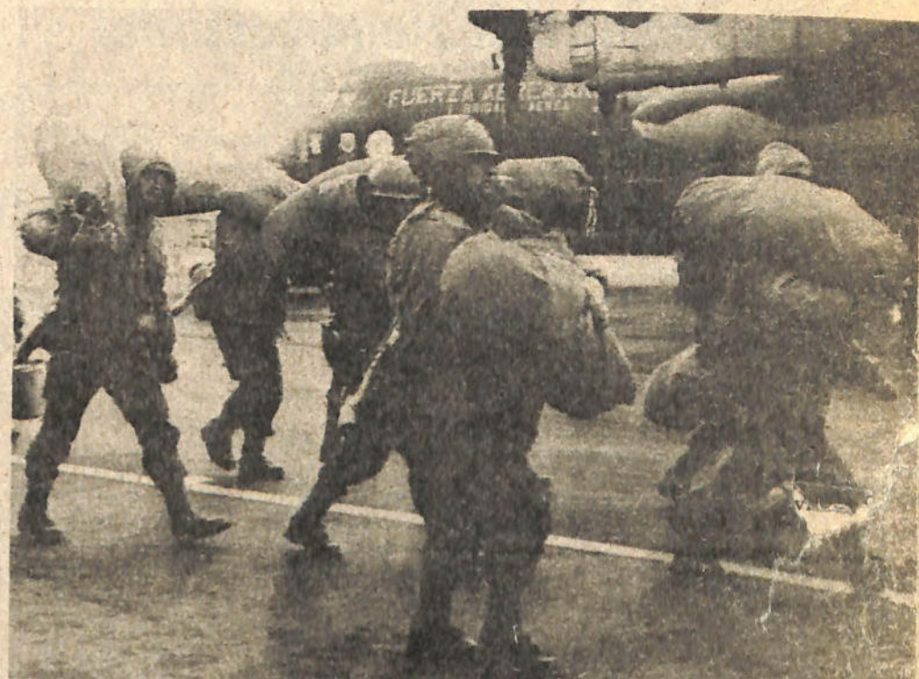
Efectivos argentinos acantonados en las Malvinas, transportan sus mochilas, para trasladarse a los lugares el que han sido destinados.