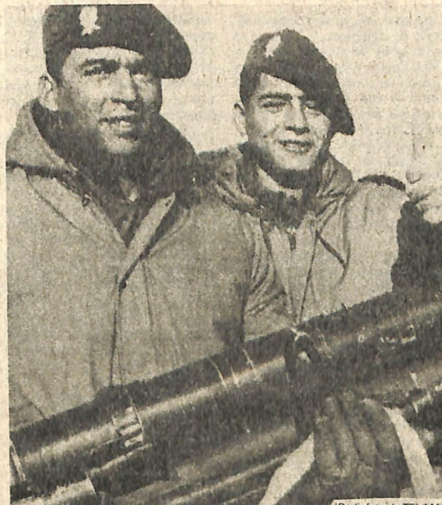
Dos soldados argentinos destacados en Puerto Argentino, Malvinas, con armamento bélico.

Asimismo, se ha establecido un sistema de custodia para que los médicos puedan trasladarse desde sus domicilios sin problema. En caso de requerirlo, cada uno de ellos serán acompañados en el trayecto por efectivos de la policía militar.