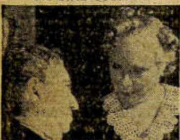
Las dos suegras, con su experiencia un poco agresiva... emocionan y hacen reír.