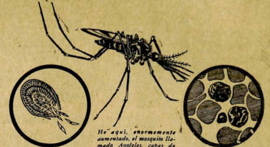
Estos microorganismos, causantes de la malaria, se ballan en el cuerpo del Anopheles, que los inyecta en el hombre al picarlo.

El paludismo, malaria o "chucho", es un mal endémico en ciertas zonas de la República Argentina producido por la hembra del mosquito Anopheles al inocular el germen mediante una picadura. Esta enfermedad presenta diversos tipos que varían según cuando aparece el germen en la sangre y da los escalofríos, la fiebre y el malestar característicos; si esto ocurre cada 3 días, se llama terciana; si cada 4 días, cuartana, etc. El paludismo deja rastros en diversos órganos y termina por minar la salud general. Ayude a aminorar el peligro de los mosquitos suprimiendo las aguas estancadas, donde aquéllos se desarrollan y multiplican. En su hogar complemente esa obra pulverizando Matamoscas Shell, insecticida aprobado por el Dpto. Nacional de Higiene, que extermina los mosquitos, moscas y otros insectos dañinos.