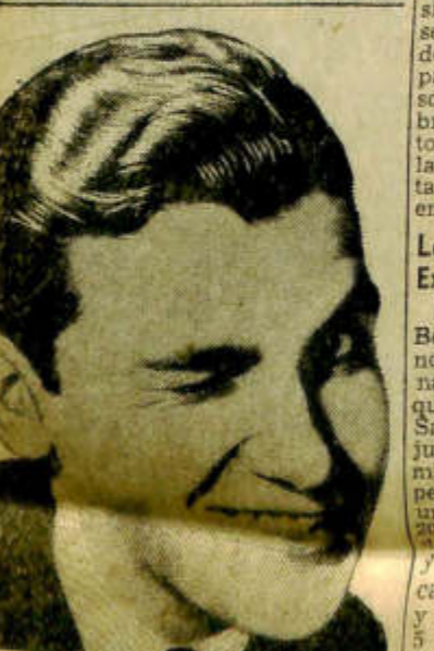
¡QUE FIJADOR FORMIDABLE!