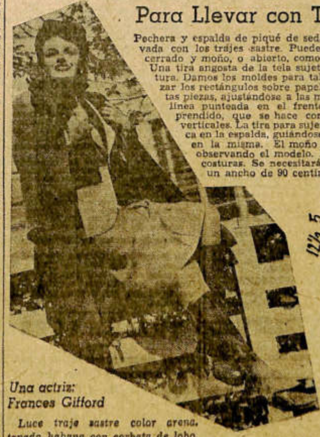
Una actriz: Frances Gifford

Una tira angosta de la tela sujeta a la pechera a la cintura. Damos los moldes para talle 46. Después de trazar los rectángulos sobre papel se dibujan las distintas piezas, ajustándose a las medidas indicadas. Una línea punteada en el frente marca el cruce del prendido, que se hace con 5 botones, en ojales verticales. La tira para sujetar a la cintura se coloca en la espalda, guiándose por la línea punteada en la misma. El moño va postizo y se arma observando el modelo. Dejar ensanche en las costuras. Se necesitará 1 metro de tela, en un ancho de 90 centímetros.