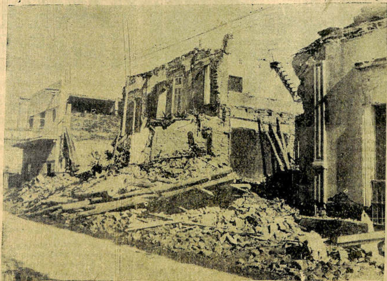
He aquí lo que quedó de la Casa del Ministerio de Agricultura. La nota gráfica ha sido tomada días después del terremoto cuando se la limpió de los escombros que la cubrían de una acera a la otra.