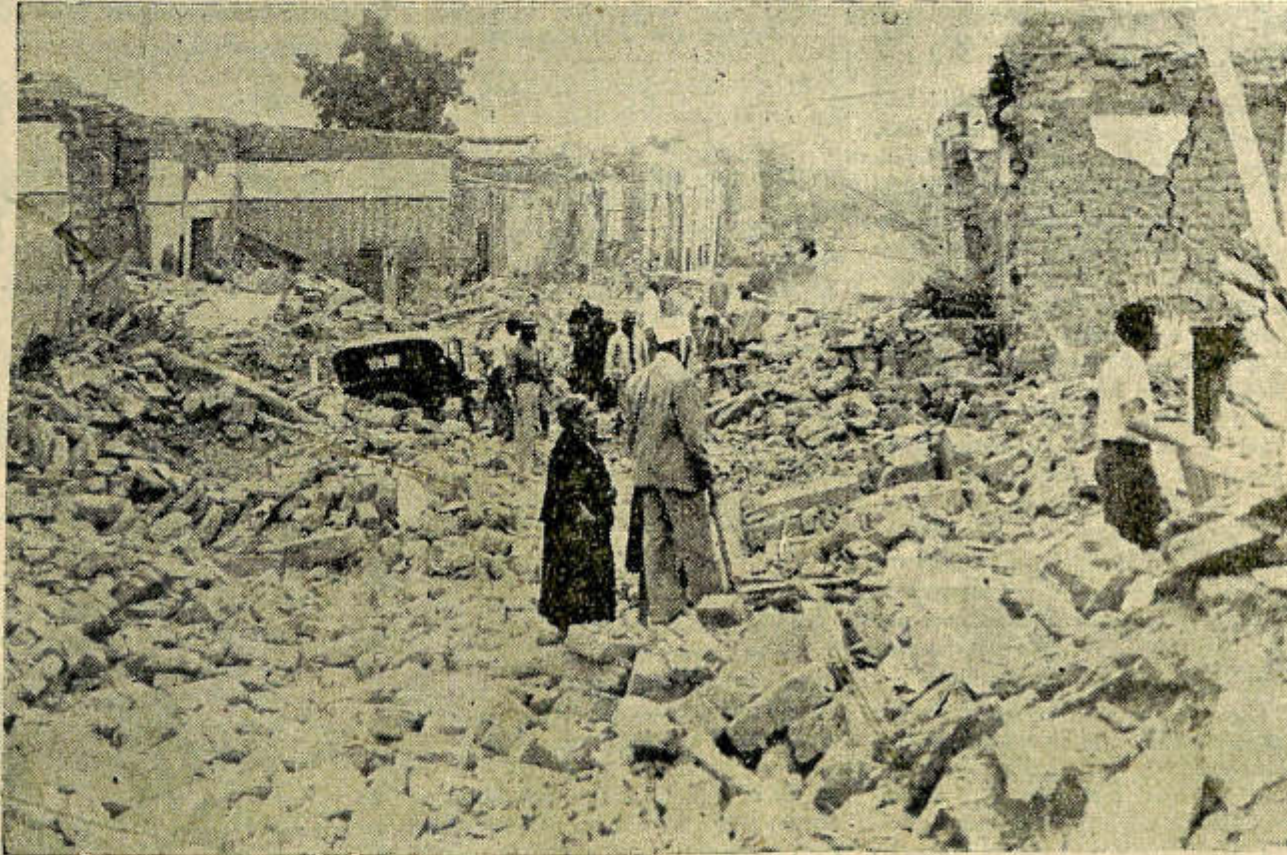
Aspecto que presentaba una de las calles céntricas del barrio de Concepción, zona en la que el terremoto del 15 de enero se sintió con mayor violencia. Como se ve en la nota gráfica la calzada quedó materialmente cubierta de escombros.