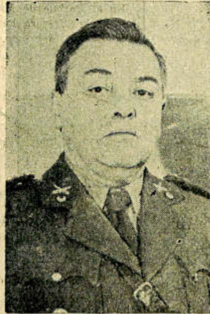
GENERAL SOSA MOLINA

Por un reciente decreto del P. E. ha sido ascendido a general de brigada el coronel don José Humberto Sosa Molina, distinguido jefe de nuestro Ejército y uno de los militares del país de mayor prestigio. Soldado de vocación, el general Sosa Molina se ha caracterizado a lo