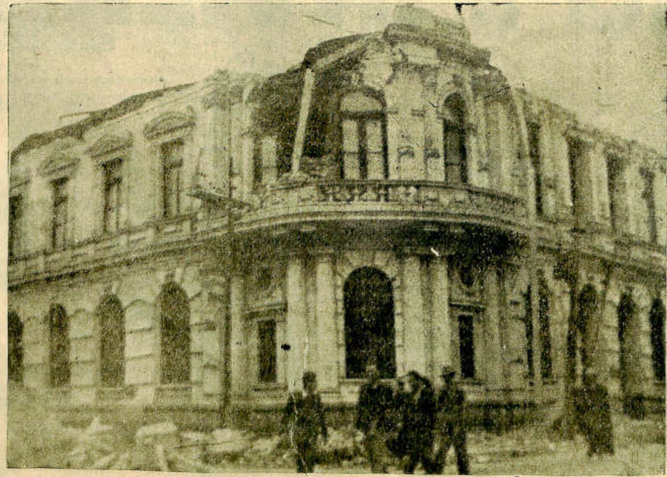
Espantosa devastación ocasionó el terremoto de Chillán (Chile) ocurrido el 25 de enero de 1939. Este edificio se derrumbó totalmente aplastando bajo sus escombros a gran número de personas.

ños, reducidos en intensidad y en radio, y que más allá de una corta distancia, no ponen en movimiento ni los aparatos más delicados. A veces, los pequeños derivan de los