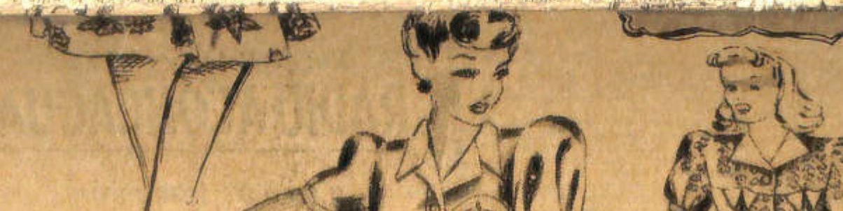
Traje de brin de algodón