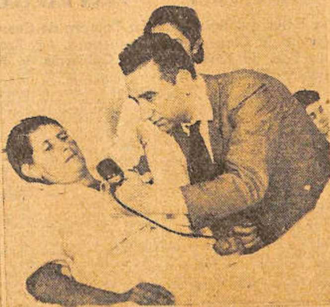
TOMANDO MENSAJES EN EL HOSPITAL CENTRAL DE MENDOZA