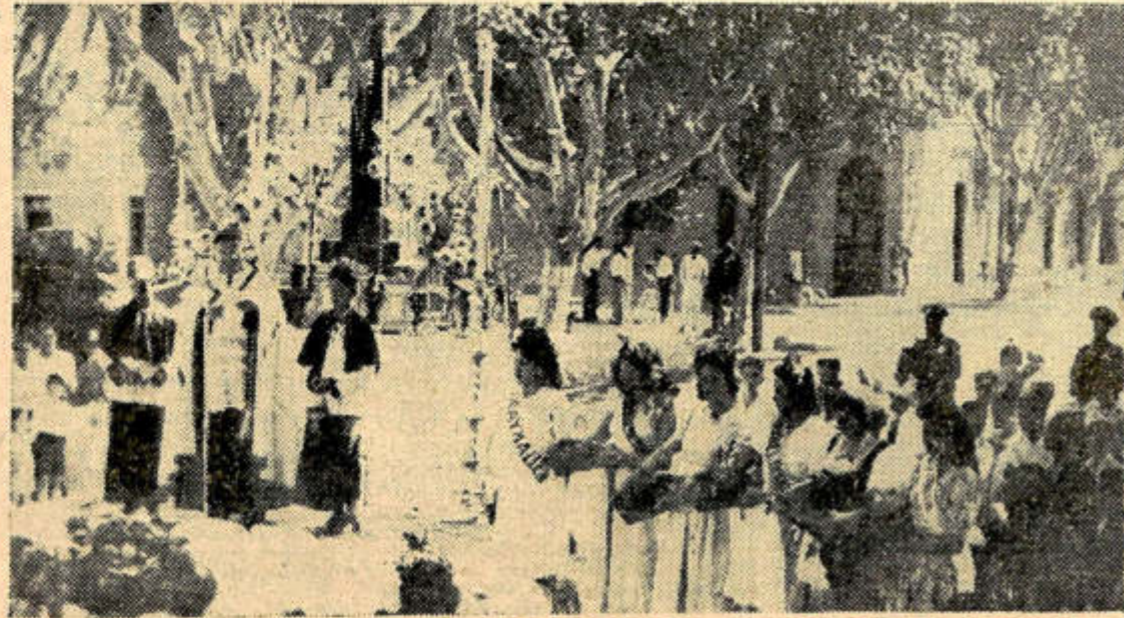
ACTOS DE LA FIESTA DE LA VENDIMIA EN GUAYMALLEN

En la Capital de la República. — Dado su elevada población, se encuentran en la Capital Federal, las cifras más elevadas en todos