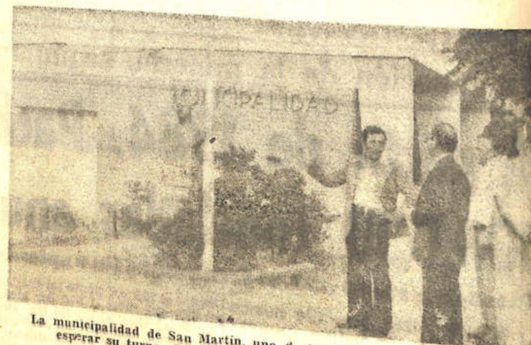
La municipalidad de San Martín, uno de los edificios públicos que deben esperar su turno. La primera prioridad estuvo representada por los canales. Ahora hay que terminar las escuelas.

Superada esta etapa, ven (CONTINUA EN LA PAGINA 7)