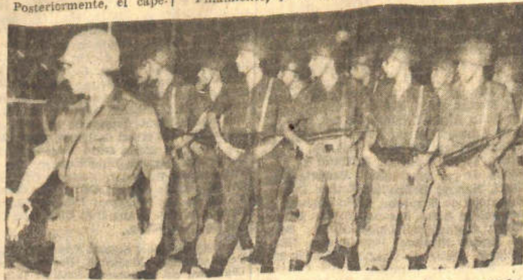
LA CEREMONIA de homenaje a los héroes de San Lorenzo, concluyó con un lucido desfile de los efectivos del Regimiento, Distrito Militar, Gendarmería y Policía provincial.

Sábado: Oficina de Rawson, que funciona en el local del Centro de Adiestramiento barrio Obrero Rawson. Domingo: Oficina de la Escuela de San Martín 1167, barrio Rivadavia. Estas oficinas atenderán al público en el horario de 9 a 13.