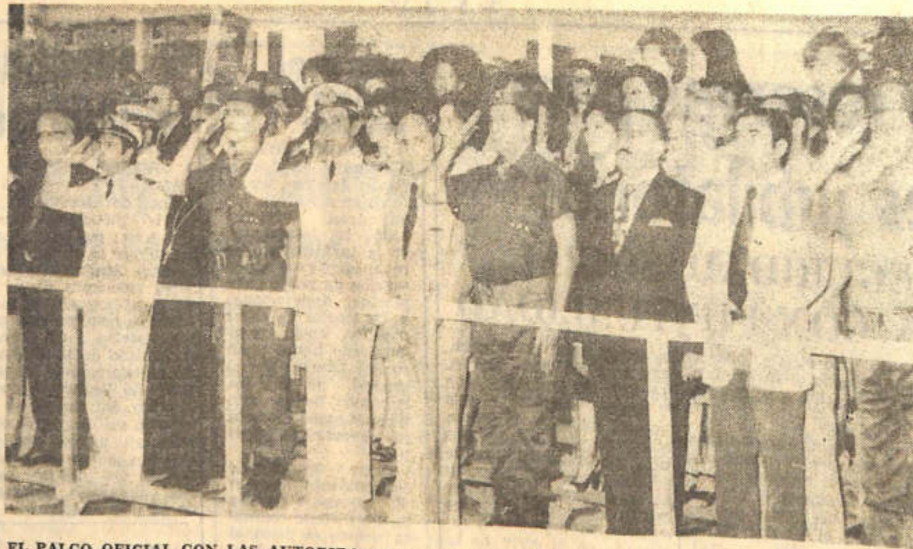
EL PALCO OFICIAL CON LAS AUTORIDADES de gobierno, militares y eclesiásticas, durante el acto en celebración del 165º aniversario de la Batalla de San Lorenzo, realizado ayer en el Dpto. San Martín.

La reactivación dinámica de esta actividad estratégica estrechamente ligada con la seguridad y la soberanía nacional, propone al país un arduo y complejo cometido, una empresa de gran envergadura sujeta al núcleo de grandes capitales y de tecnología en alta escala, cuyas ciertas perspectivas de futuro configuran un atractivo para los inversionistas argentinos y extranjeros. Dentro de la complejidad y magnitud que la faz ejecutiva de su aplicación plantea, es dable advertir que la política de promoción minera, llamada a incentivarse a partir de este año, tiene claros objetivos. Entre ellos, asegurar bases de abastecimiento interno para las industrias de transformación, especialmente la pesada, la metalúrgica, la siderúrgica y la petroquímica, sustituir importaciones e incentivar la integración de economías regionales, creando fuentes de mano de obra local, tanto por la actividad prospectiva y extractiva, cuanto por el procesamiento de minerales dentro