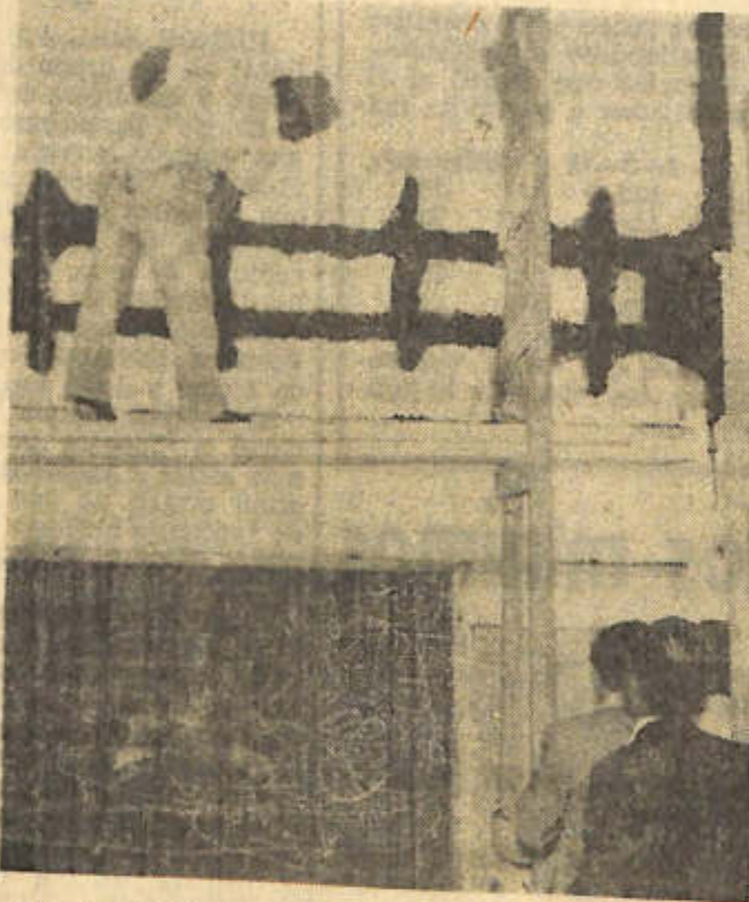
ESTE TRABAJO se realiza en la Escuela Normal Sarmiento y en muchas más. Se lo denomina "costura" y consiste en penetrar las fisuras y rellenarlas con hierro y cemento transversal. La mampostería recupera totalmente su firmeza.

Colaboran activamente en esta tarea los técnicos del Instituto de Investigaciones Antisísmicas de la Universidad Nacional de