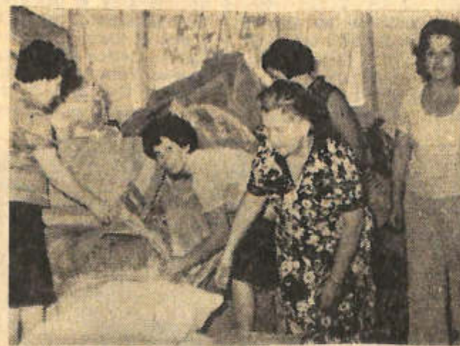
ASOCIADAS y voluntarias de Caritas San Juan preparan las donaciones para su distribución.

Asimismo, Caritas ha constituido un cuerpo de voluntarios integrado por 15 personas que trabajan en las actividades de auxilio que realiza la comisión directiva.