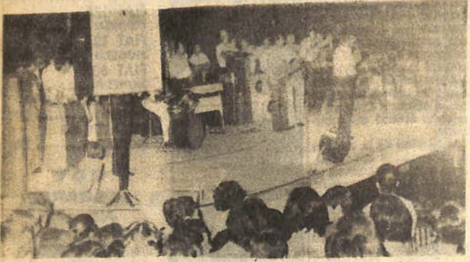
NUMEROS ARTISTICOS y disparos de bombas de estruendo conformaron anoche la fiesta de apertura del Carnaval Sanjuanino 1978, cumplida en la plaza Hipólito Yrigoyen ante numeroso público.

HABRA "CHAYA LIBRE" HOY Y MAÑANA, DE 14 A 18. EN ESE HORARIO NO CIRCULARAN LOS OMNIBUS. CORSO INFANTIL EL DIA JUEVES EN LA AVENIDA CENTRAL Y PRESENTACION DE LAS CANDIDATAS A REINA EL SABADO PROXIMO