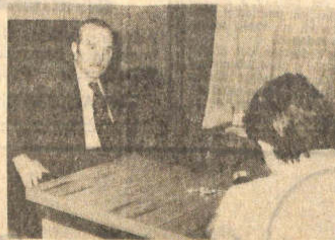
El gerente del Banco Nación informa a DIARIO DE CUYO, los detalles sobre préstamos personales y familiares.