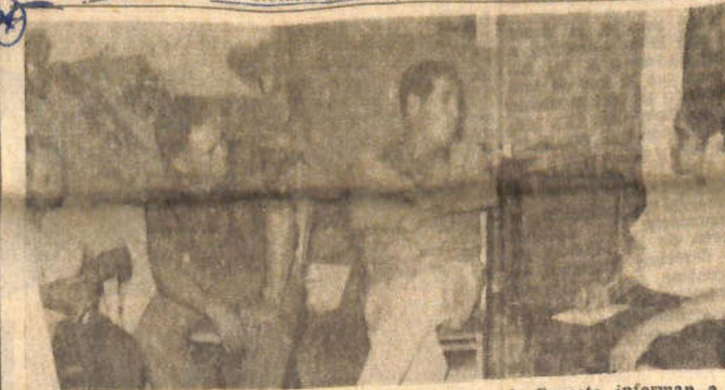
Dirigentes de la Federación de Uniones Vecinales de Caucete, informan a DIARIO DE CUYO sobre el encuentro con un funcionario del Banco Hipotecario.

largoamente esperado de contar con el importante servicio del agua potable.