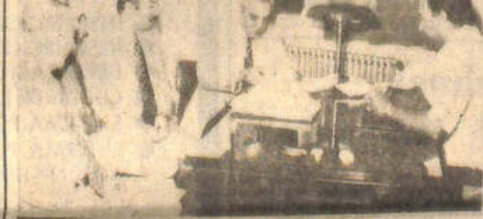
Autoridades firman el convenio