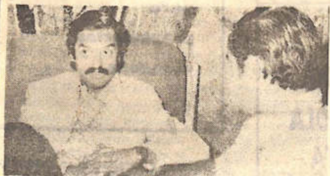
El gerente de Operaciones Inmobiliarias de la casa central del Banco Hipotecario Nacional,

Si el recurso prosperare, el depósito será devuelto a quien lo hizo. Caso contrario — sea por inadmisibilidad formal o de fondo — su importe será destinado a adquisiciones para la Corte.