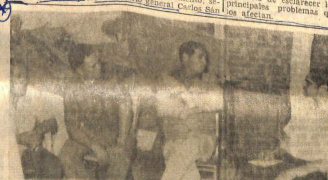
Dirigentes de la Federación de Uniones Vecinales de Caucete, informan a DIARIO DE CUYO sobre el encuentro con un funcionario del Banco Hipotecario.

lo largamente esperado de contar con el importante servicio del agua potable.