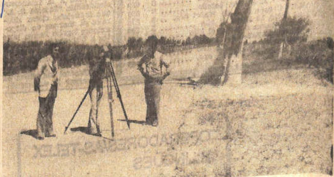
La nota gráfica muestra los trabajos previos a la pavimentación de la calle San Luis, en el departamento Sarmiento.

Expresó después el coronel Delfino que la CAVIC oficiará de intermediaria de los productores ante el Banco de San Juan —como lo hizo el año pasado— para que los viticultores puedan obtener préstamos con destino al acarreo y la elaboración, con la sola presentación de la solicitud. Informó que la entidad crediticia otorgará 6 pesos para la elaboración y 2,50 para el transporte.