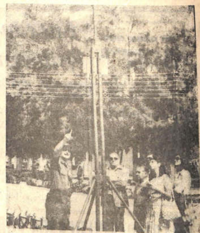
EL JEFE del Regimiento muestra los hitos que serán colocados durante el trayecto a la cordillera.

Por aquí pasó el general San Martín junto con la columna principal del Ejército de los Andes a cargo del mayor general brigadier Miguel Estanislao Soler. En el bicentenario del natalicio del general San Martín, 1778-25 de febrero-1978".