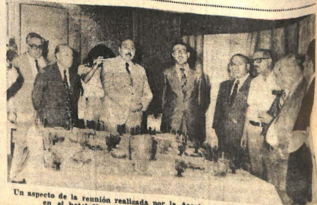
Un aspecto de la reunión realizada por la Asociación de Crédito Mendoza, en el hotel Nogaró, en cuya transcurso fueron agasajados representantes del periodismo local.

Las reuniones se efectuarán en los locales municipales de cada uno de los departamentos nombrados. En 9 de Julio, a las 18.30 de hoy, y en 25 de Mayo, mañana, a las 9.30.