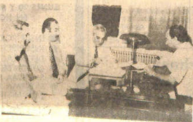
Autoridades firman el convenio

La obra, de significativa importancia para una vasta zona de Santa Lucía, será financiada con partidas provenientes del Fondo de Desarrollo Zonal y satisfará un caro anhelo de los pobladores de las colonias Gutiérrez y Zapata, beneficiando a más de cuatro mil habitantes, según lo señala el comunicado de la Dirección de Información Pública del gobierno. Esta primera etapa de tendido de las cañerías, alcanza a los 12 mil metros y la obra se pondrá en ejecución el próximo viernes. El plazo de finalización fue estimado en un año y el monto del contrato alcanza a los 100.076.636 pesos.